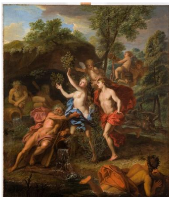
Guy-Louis Vernansal: Apolló és Daphné

Daphnéért lobogott legelőször lánggal Apolló, mit nem a véletlen, de Cupido vad dühe gyújtott. [...] Elsápadt a leány, erejét vesztette a gyötrő vad rohanásban; a Peneos habjára tekintve, „Ments meg, apám,” így szól, „folyamok, ha van istenerőtök! Túlsággal tetszem; hát nyíl meg, föld, vagy a testem változtasd mássá: ez okozza az én veszedelmem.” Így csak alig szólt esdve, merev lett máris a teste, zsenge leánykebelét tüstént friss kéreg övezte. Fürtjei lombokká, fordult két karja faággá; s lába, imént oly gyors, végződik lomha gyökérben; arcát lomb fedi már, egyedül szép fénye a régi.