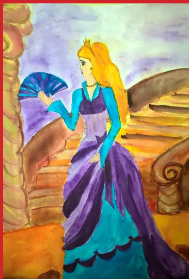
Back Annamária, X. A