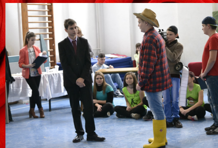
- Licisták farsangja, 11. oldal -