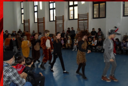
- Kicsik farsangja, 11. oldal -

*Igazából a nem szökőévekben február 28-án van ez a nap, de ezt csak alapos keresgélés után lehet kideríteni. És az a mondat amúgy is jól hangzik. Nem szabad elrontani ezzel a kiegészítéssel. ©