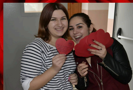
- Szívek inváziója a Csikyben, 11. oldal -