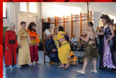
- Itt a farsang, áll a bál!, 11. oldal -