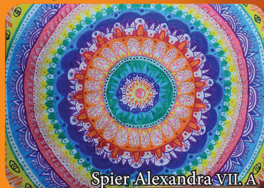
Spier Alexandra VII. A

Nem kell mást tenned, mint eljuttatni őket Dórihoz vagy Vicushoz (XI. A)! :D