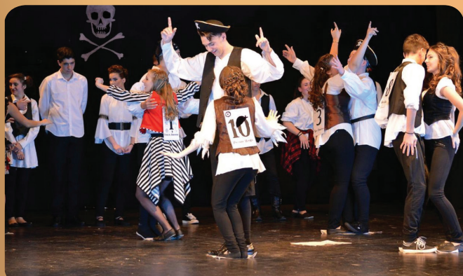
Fergeteges gólyabál idén is! - 11. oldal