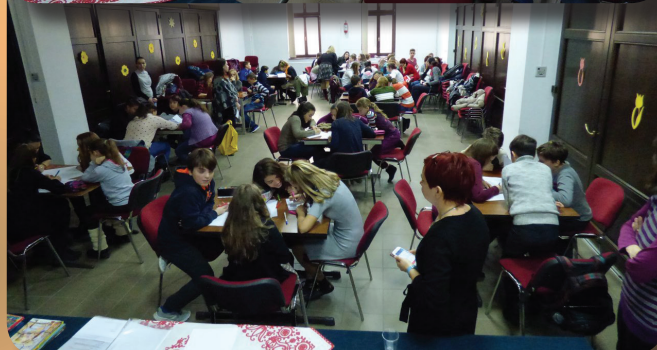
A magyar nyelv napja - 10. oldal