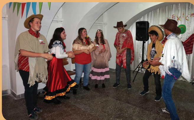
Mexikói gólyabál az intriben - 9. oldal