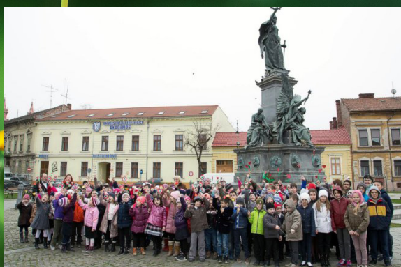
Nyílt nap és ünnepség a Csikyben, 10. oldal