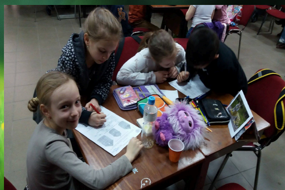
Ismét kuruttyoltunk, 9. oldal