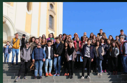
Határtalanul a 9. C-ben, 10. oldal