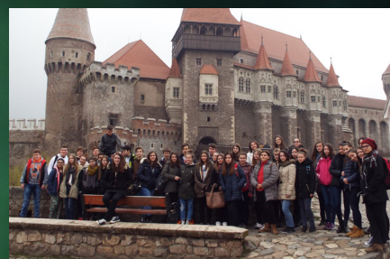
Csapatösszerázás Algyógyon, 10. oldal