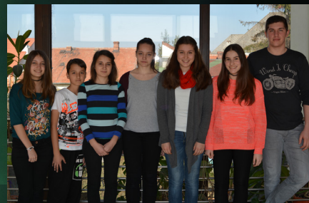
Csikysek a magyar nyelv és irodalom tantárgyversenyen, 9. oldal