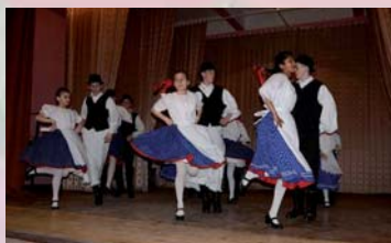
Mesztegyőiek Aradon - 7. oldal