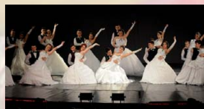
Maturandus - 11. oldal