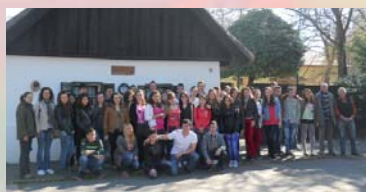
„Borban az igazság” Csikysek Szegeden 4. oldal