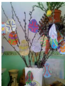
Kreatív kézimunka III. osztály