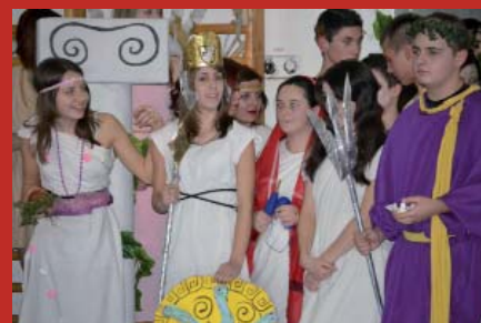
IX. B osztály