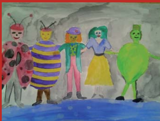
Cseh Jenifer VIII.B