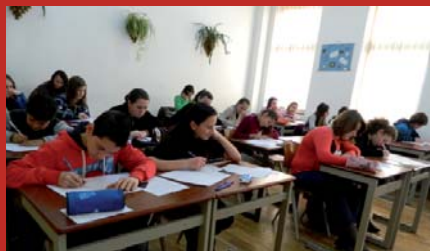
Mikes Kelemen tantárgyverseny (10. oldal)