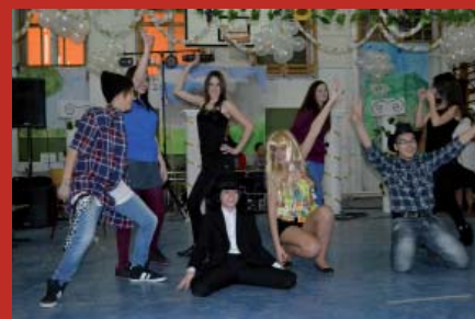
IX. A osztály