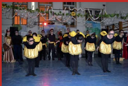
Olümposz a Csikyben (7. oldal)