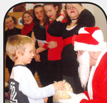
részletek a 10. oldalon