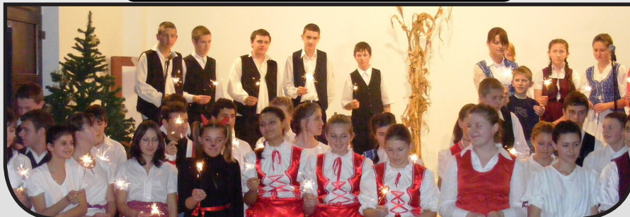
részletek a 11. oldalon