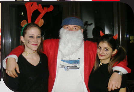
részletek a 8. oldalon