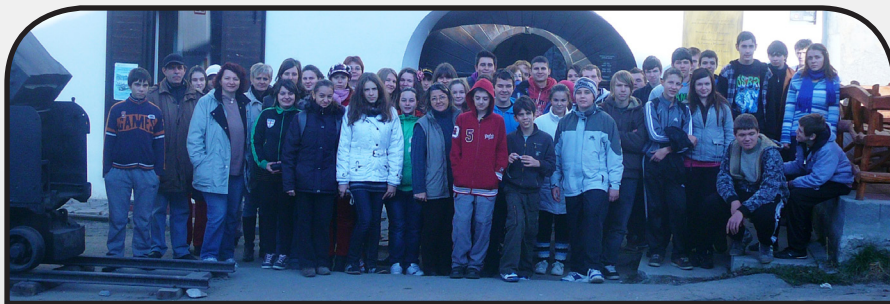
részletek a 10. oldalon