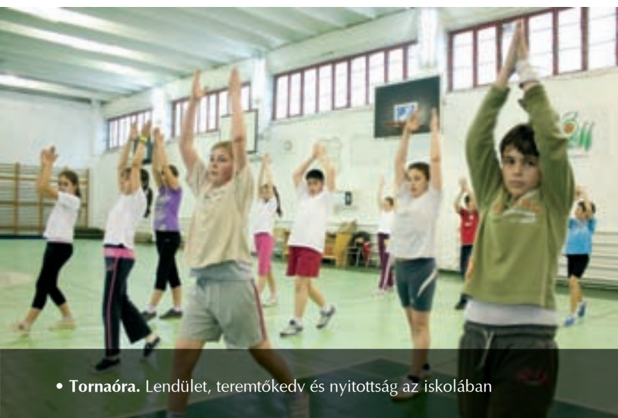
• Tornaóra. Lendület, teremtőkedv és nyitottság az iskolában