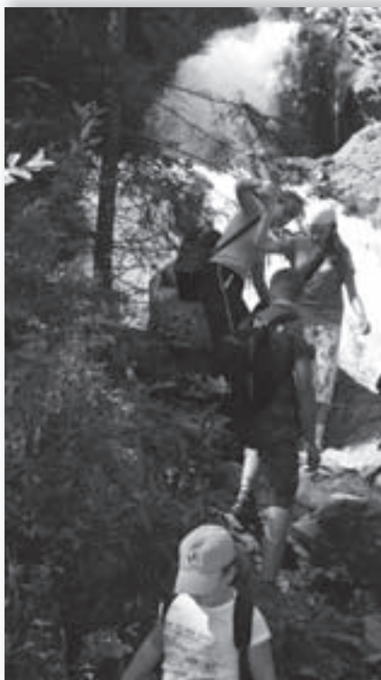
• Magyarországi gyermekek a Kolozs megyei havasrekettyei vízesésnél, 2010-ben

Sándor Krisztina MIT-elnök a Magyar Közoktatás kérdésére elmondta, ez előzetes számítások szerint az idei kiírásból mintegy 8 ezer diák választhatja a magyarul tanuló romániai területeket. Az ide érkezők mintegy fele várhatóan a Székelyföldre érkeznek, és sokan jönnek majd a Partiumba is. Mivel a program tulajdonképpen csak szeptemberben indul, az idegenforgalom szempontjából szinte holt szezonban érkeznek majd a tanulók, az Apáczai Közalapítvány felmérése szerint leginkább a szeptember-október, illetve a 2012 április-május környéke lesz a legnépszerűbb a magyarországi diákok számára. Természetesen érkeznek majd más időpontokban is, de a többség a mérések szerint ekkor kíván utazni. Kérdésünkre, hogy a diákok mintegy kétharmada várhatóan miért éppen a romániai településeket választja majd,