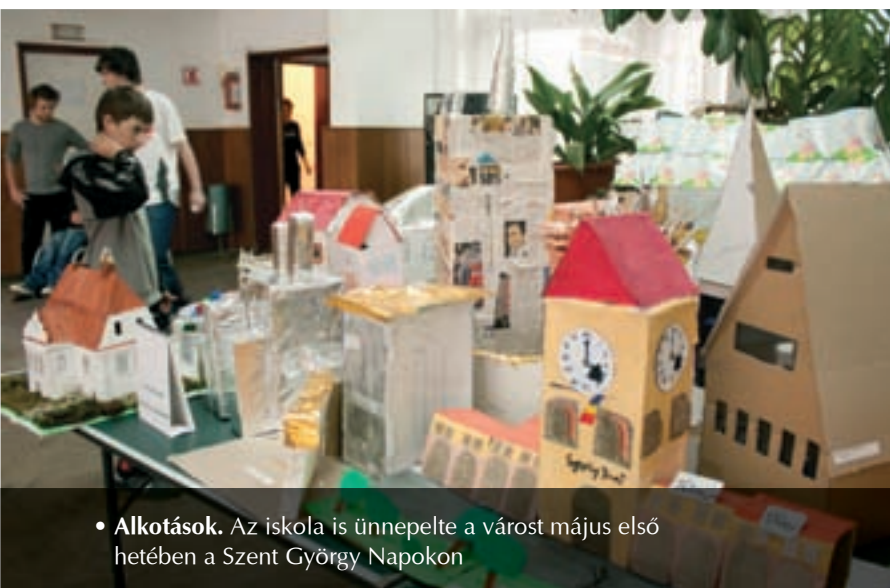
• Alkotások. Az iskola is ünnepelte a várost május első hetében a Szent György Napokon