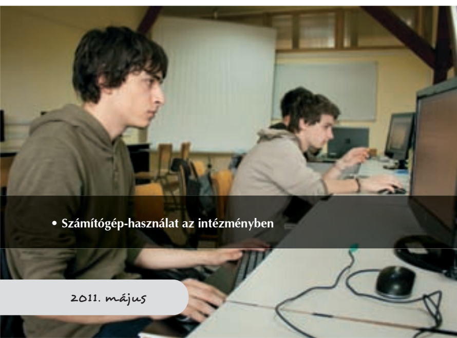
• Számítógép-használat az intézményben