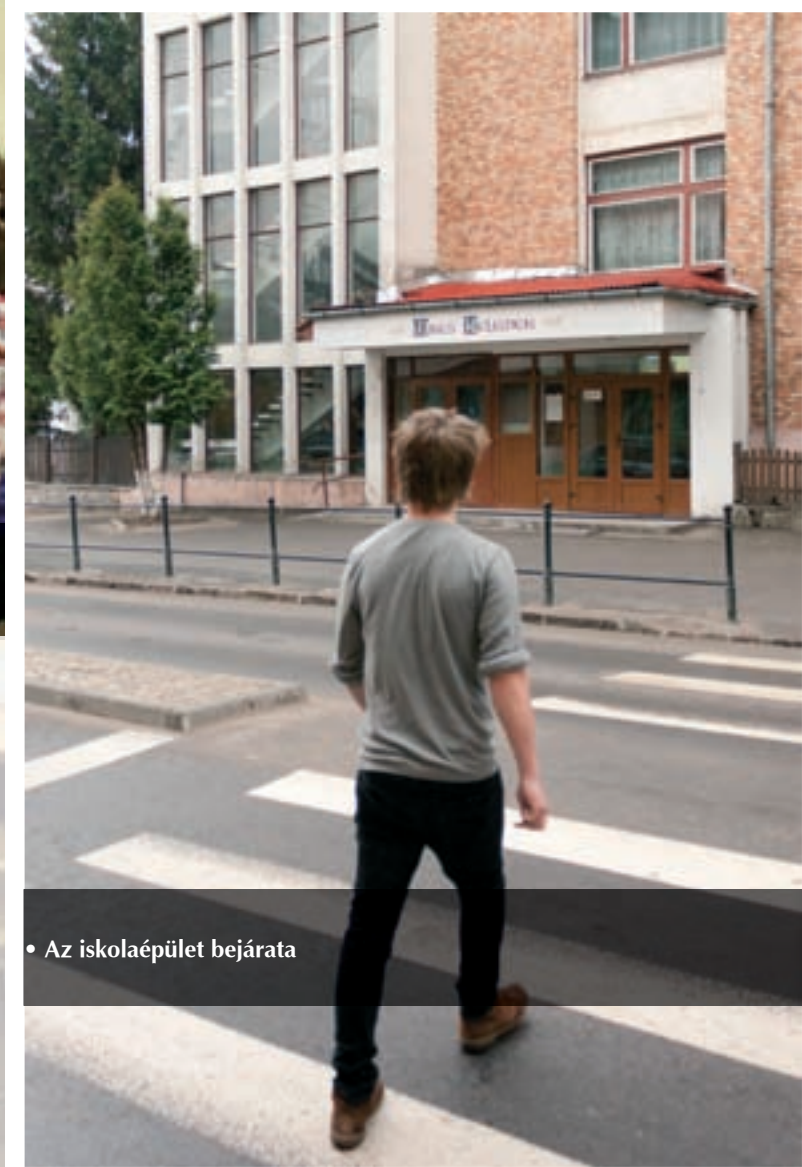
• Az iskolaépület bejárata