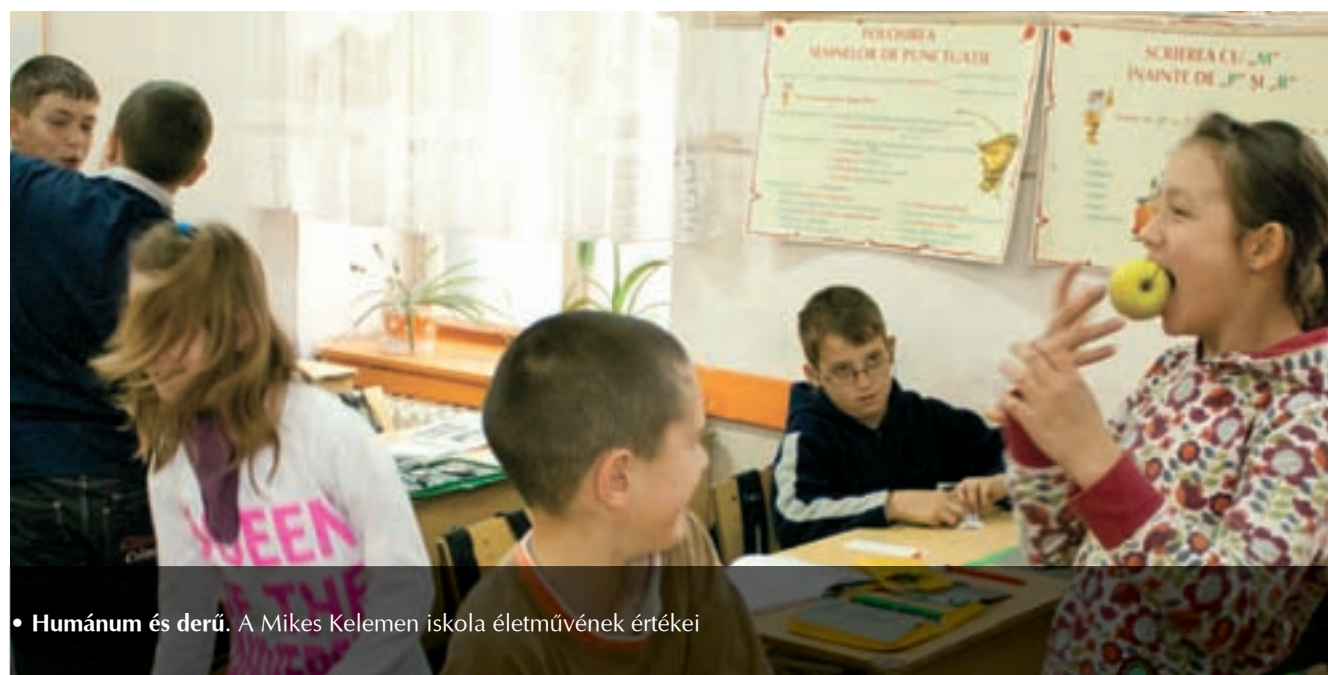
• Humánus és derű. A Mikes Kelemen iskola életművének értékei

A Mikes Kelemen Elméleti Líceum Erdély egyik legjobb eredményeket felmutató magyar tannyelvű középiskolája. Sepsiszentgyörgy város központjában, a Kós Károly és a Kriza János utca kereszteződésénél két iskolaépületben ad otthont több mint 1200 tanulónak. Az intézmény 48 osztályában elemi, gimnáziumi és líceumi oktatás folyik magyar nyelven.