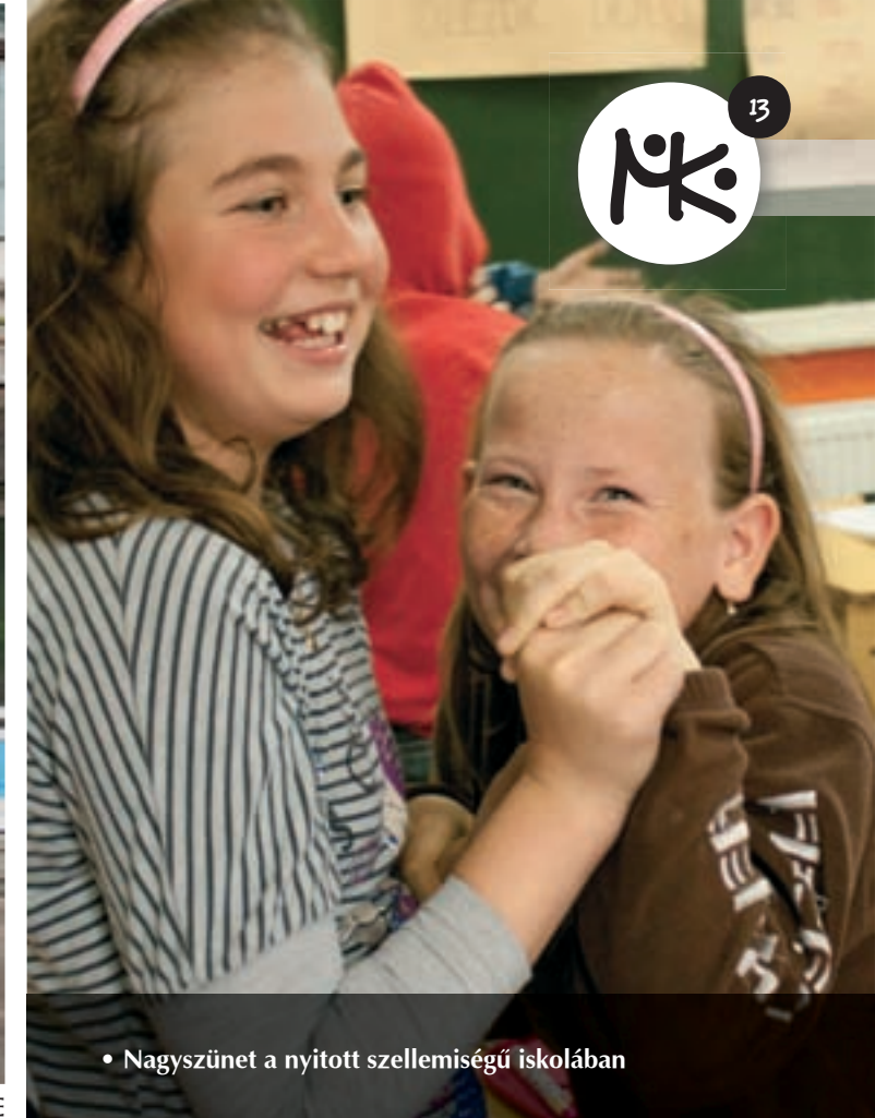
• Nagyszünet a nyitott szellemiségű iskolában