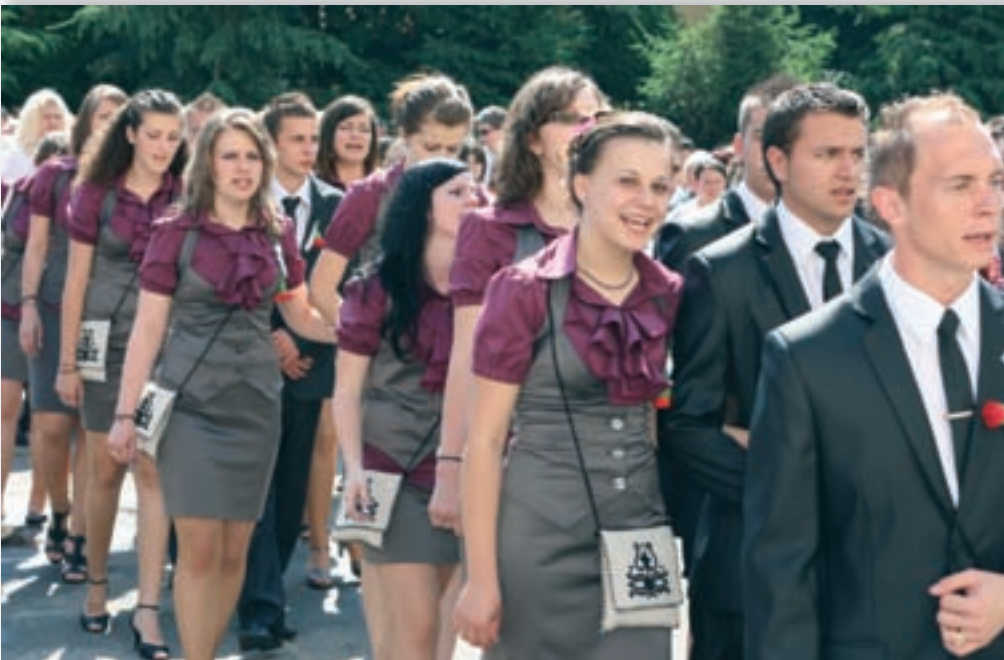
Fotók • GOZNER GERTRUD. • KÉPEINK ILLUSZTRÁCIÓK

A nagyváradai Mihai Eminescu Főgimnázium 12. H. osztályosainak véleménye a ballagásról, a középiskola befejezéséről, a nagybetűs Életbe való kilépésről