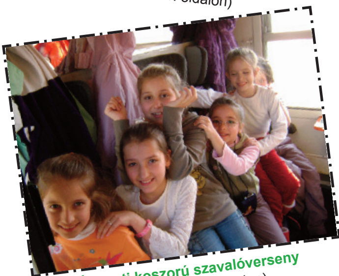
Ádventi koszorú szavalóverseny (részletek a 10. oldalon)