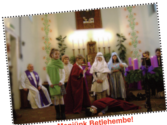
Menjünk Betlehembel! (részletek a 10. oldalon)