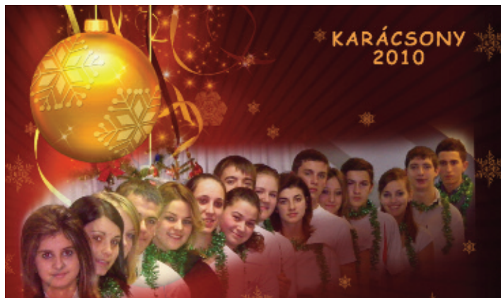
Intrijó (9. oldal)