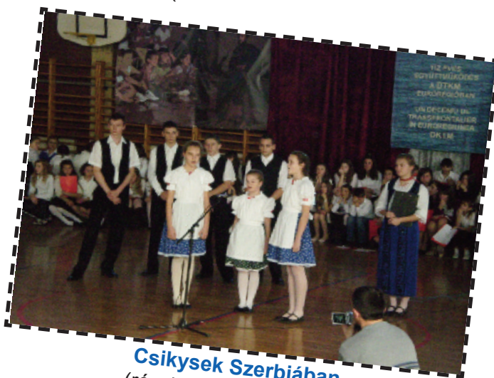
Csikysek Szerbiában (részletek a 11. oldalon)