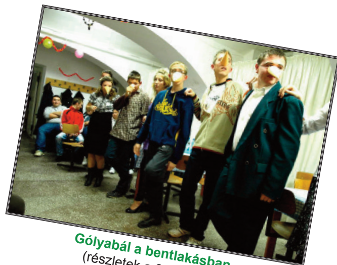
Gólyabál a bentlakásban (részletek a 3. oldalon)