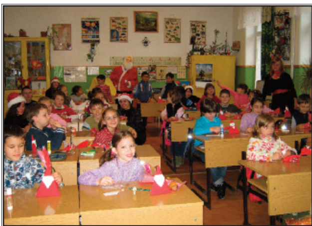
Mikulás-nap a Csikyben (részletek a 11. oldalon)