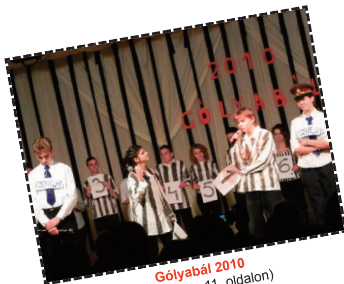
Gólyabál 2010 (részletek a 11. oldalon)