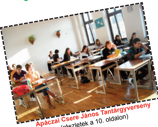
Apáczai Csere János Tantárgyverseny (részletek a 10. oldalon)