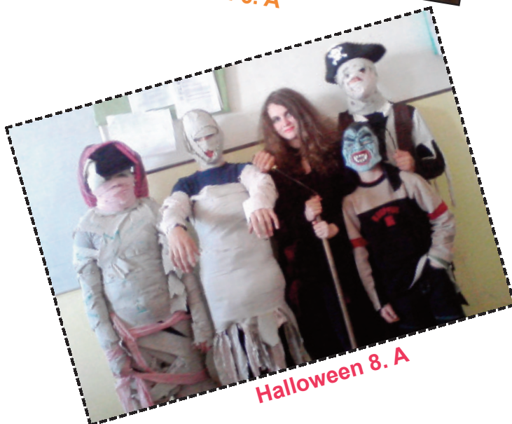
Halloween 8. A