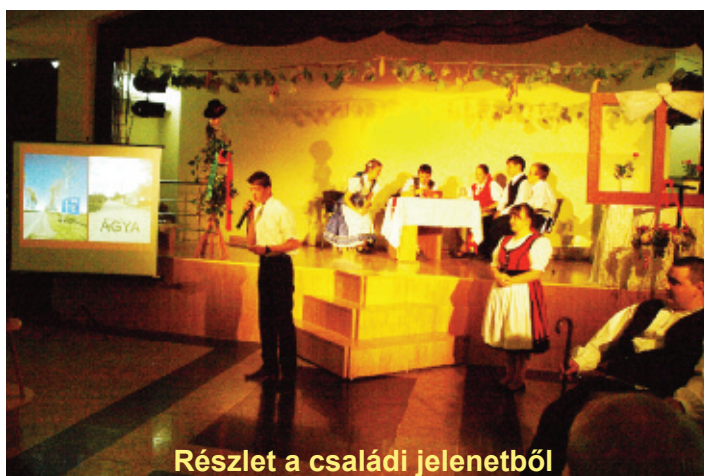
Részlet a családi jelenetből

Anyuka és apuka várják haza gyermekeiket, akik a környező falvakban laknak. A szülők már idősek, és nem tudnak elutazni, ezért a gyermekek egy-egy projekt révén mutatják be, hogy hol élnek. A faluban