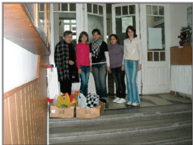
Zöldséggyűjtés (részletek a 10. oldalon)