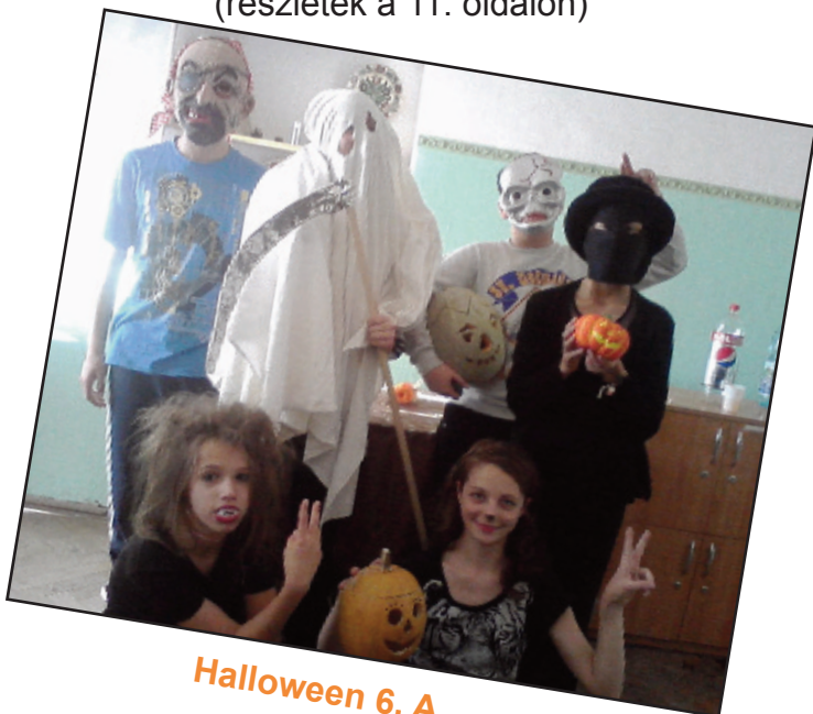
Halloween 6. A