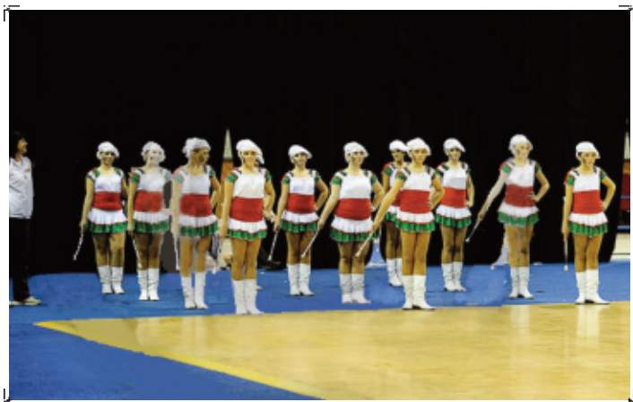
Svájci Európa-baknokság (részletek a 11. oldalon)