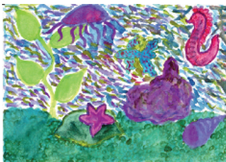
Birta Gyöngyi, 5. B