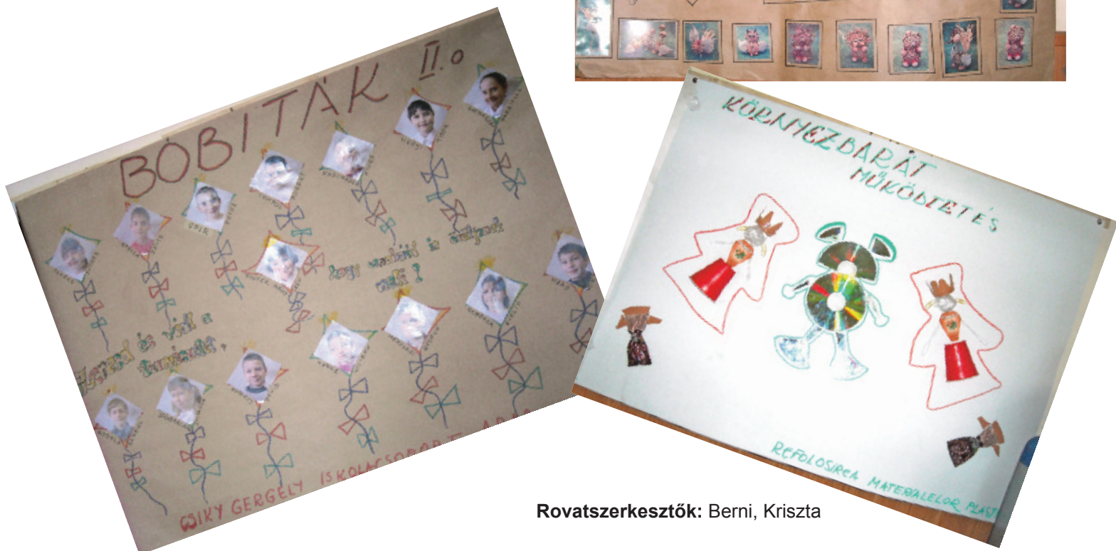
Rovatszerkesztők: Berni, Kriszta