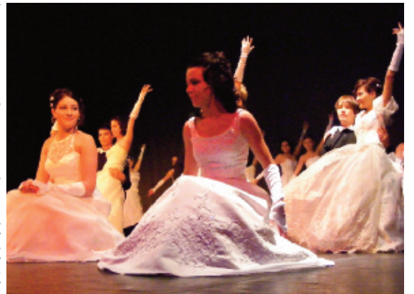
Szalagavató ünnepség képekben (folytatás a 11. oldalon)