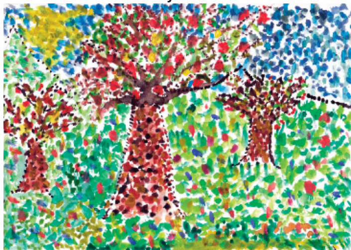
Rudolf Ábrahám 5. osztály